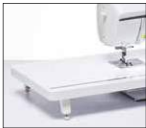
Table d'extension extra-large

Agrandissez votre plan de travail avec cette table d'extension extra-large. Idéale pour les ouvrages de quilting et de couture de grande taille. La table dispose d'une règle et d'un espace de rangement pour votre genouillère.